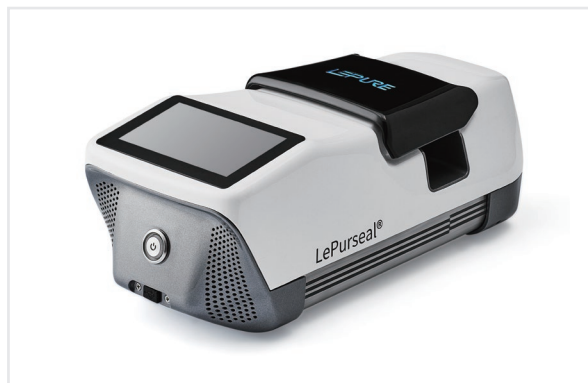
LePurweld®全自动无菌封管机 II

Le-Flex® 热塑管适用于无菌传输、制剂灌装、取样等生物制药过程中的多种流体传输的应用场景。